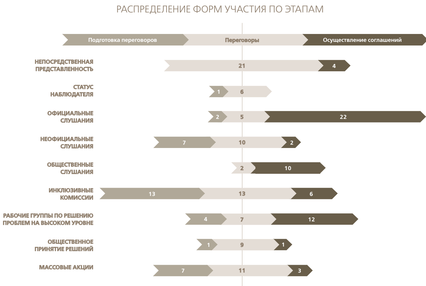
РИС. 3. Распределение форм участия по этапам

Мирные переговоры в 1994–1997 годах в Мексике показали, что различные формы участия не исключают друг друга и что существует ряд возможностей и способов вовлечения женщин в процесс мирных переговоров (рис. 2). На переговорах с правительством Мексики Сапатистская армия национального освобождения (EZLN) обратилась к различным формам участия, чтобы оказать давление на правительство с целью начала и продолжения переговоров, укрепить свою законность и создать новые возможности для своих делегатов вносить значимый вклад в процесс.