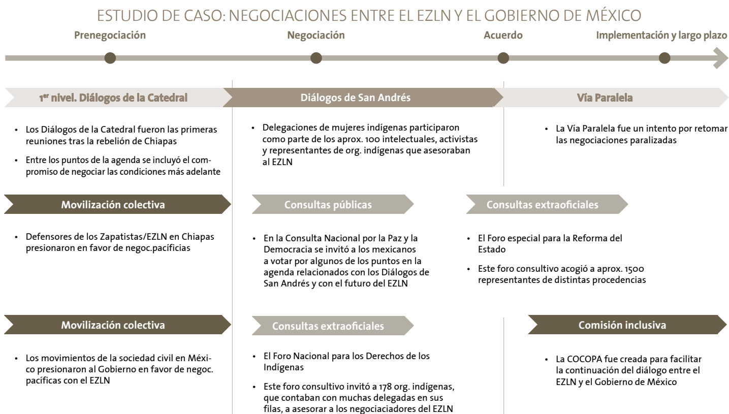
FIGURA 2: Modelos de inclusión en las diferentes fases del proceso de negociación

** Cronología aproximada del caso. Las flechas representan las modalidades de inclusión en niveles aproximados de lejanía con respecto al proceso de negociación de primer nivel (en gris).